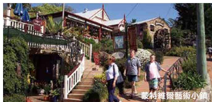
蒙特維爾藝術小鎮

Sunshine Coast ~ Montville ~ Mooloolaba Canal Cruise ~ Australia Zoo ~ Glass House Mountain ~ Brisbane → Auckland