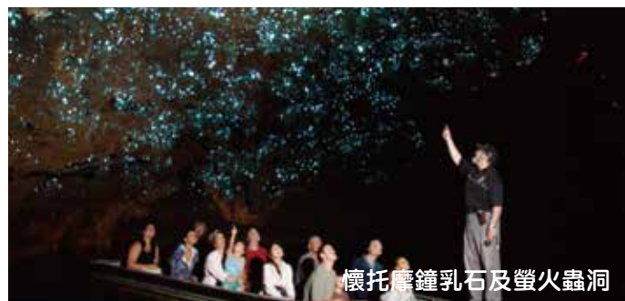
懷托摩鐘乳石及螢火蟲洞

奧克蘭 ~ 懷托摩鐘乳石及螢火蟲洞 ~ 鹿產品工場 ~ 彩虹鱒魚場 ~ 羅托魯亞 ~ 紐西蘭傳統石頭烤肉自助晚餐連毛里族歌舞表演 ~ 晚上自費活動【波利尼西亞露天地熱溫泉浴】 Auckland ~ Waitomo Glow Worm Cave ~ Deer Shop ~ Rainbow Spring ~ Rotorua ~ Hangi Dinner & Maori Concert ~ Polynesian Spa (Optional)