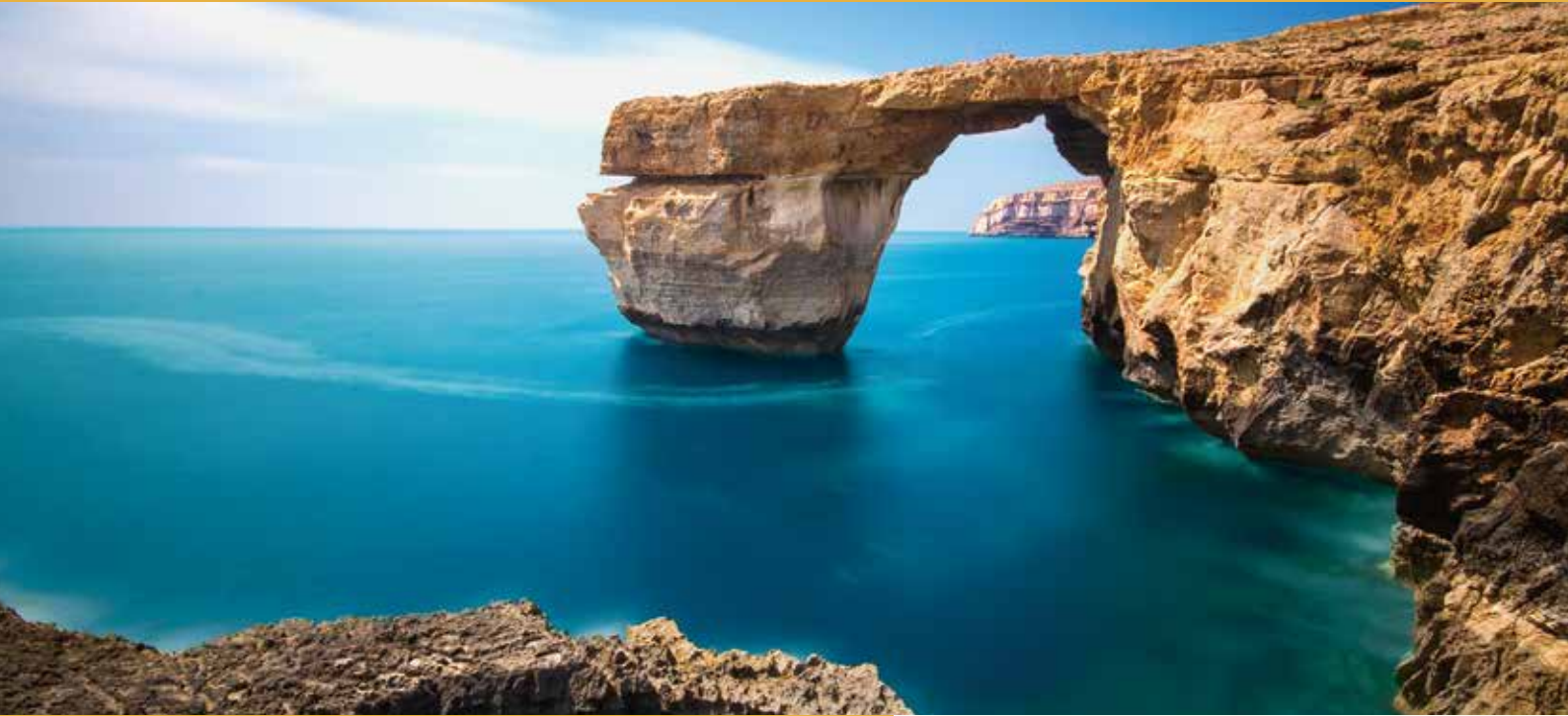
馬爾他 – 藍窗