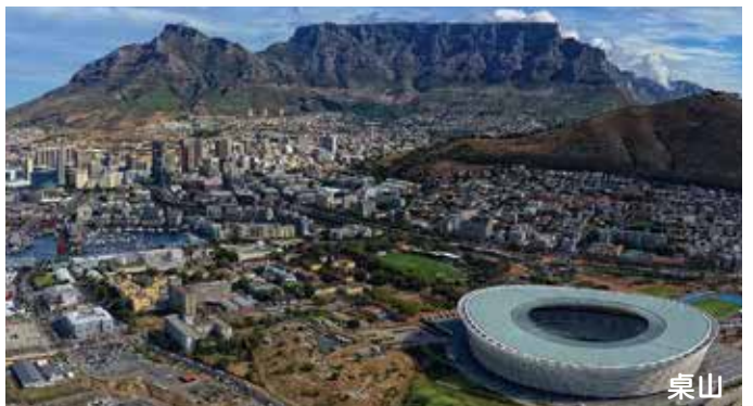
Table Mountain ~ V &amp; A Victoria Shopping Mall

早餐後專車往機場乘內陸客機飛往南非最美麗城市一開普頓。抵達後即乘遊覽車往著名的駝鳥園，及參觀園內的小型博物館，並了解飼養駝鳥過程，同時可嘗試騎駝鳥。午餐於園內品嚐駝鳥肉餐後驅車前往纜車站轉乘最新旋轉吊車，登上高聳入雲，外型平如桌面的桌山，觀賞全市景色，遠眺大西洋海岸無盡景緻，忘盡煩憂(若因天氣或維修影響而停開吊車，將改遊覽訊號山取代)。繼往具歐陸色彩及以購物娛樂集於一身的V&A維多利亞海濱娛樂城遊覽。遊畢返回開普頓市區。