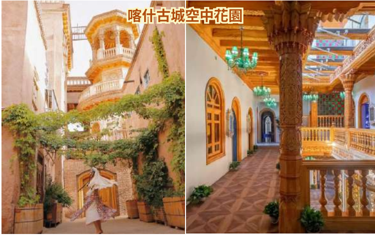
喀什古城空中花園

大小龍池，又稱雙龍池，是天山獨庫公路邊上的兩個高山湖泊。大龍池和小龍池相距約 4公里 ，海拔分別為 2390米 和 3700米 。周圍綠草如茵，雲杉蔥郁，湖光山色交相輝映，宛如人間仙境。