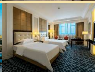
阿克蘇希爾頓花園酒店