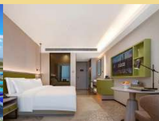
喀什南疆環球港國際酒店