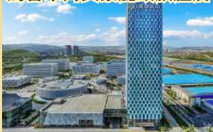
烏魯木齊美豪麗致旗艦店