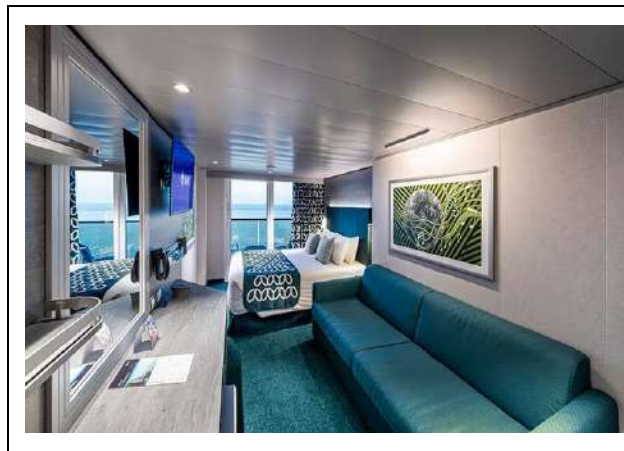
(海景露台房 - BR)