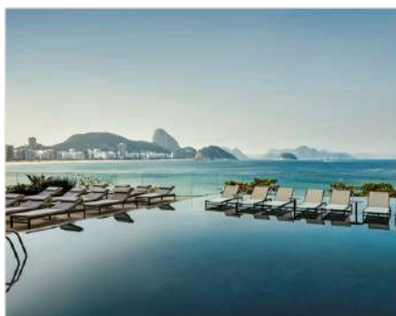
5★ 里約熱內盧 Fairmont Rio de Janeiro Copacabana