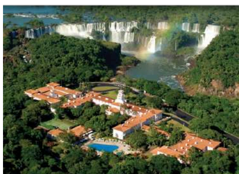
5★ 伊圭蘇瀑布 Belmond Das Cataratas