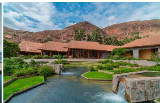
5★ 印加河谷 Tambo Del Inka Resort