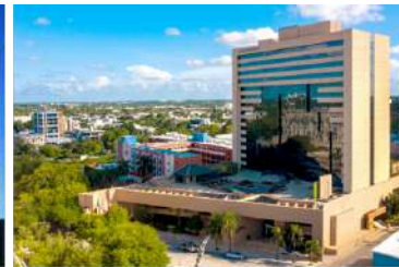
5* Hyatt Regency