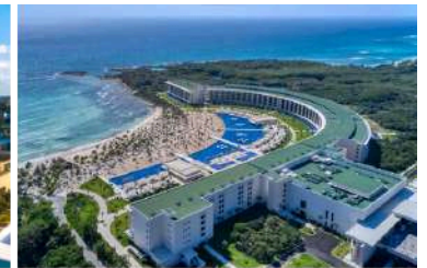
5* Barceló Maya Riviera

❖ 普埃布拉 (世遺小鎮)：連續3晚住 - 5* Banyan Tree Puebla 或同級酒店