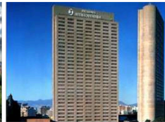
5* InterContinental Presidente