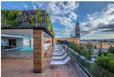
5* Banyan Tree Puebla