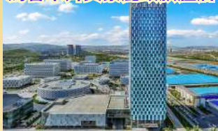
烏魯木齊美豪麗致旗艦店